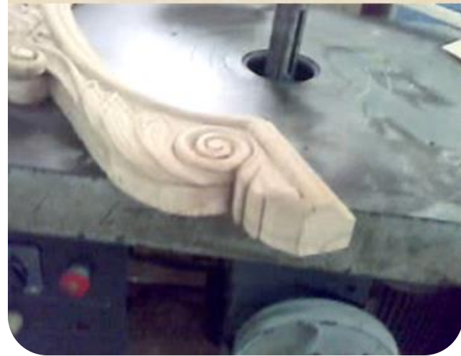
الحفر على الخشب