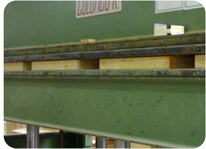
دخول الخشب المكبس الحرارى